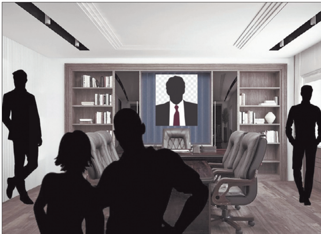
Пьеса «Губернатор» – о кривизне власти, забывающей, что она, собственно, для людей