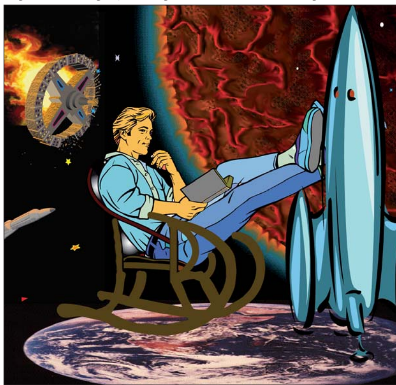
Рисунки Александра ДАНИЛКИНА

новой нравственных тяготений. Но он не исключал и того, что человеческие возможности, в том числе и биологические, с тех пор значительно возросли. Во всяком случае, неминуемо претерпели изменения, и, возможно, его нравственные тяготения не вписываются в нынешние постулаты. Всё как бы то же самое, но на другой ступени понимания. Они говорят, что по биологическому времени ему шестьсот лет, а по старому земному летоисчислению — более десяти тысяч. За свою жизнь он насмотрелся всего, его невозможно удивить. И всё же он удивился. Оказывается, по земному сегодняшнему времени ему всего пять лет. Впрочем, как раз в этом нет ничего удивительного, ведь со времён его отсутствия летоисчисление на Земле менялось трижды.