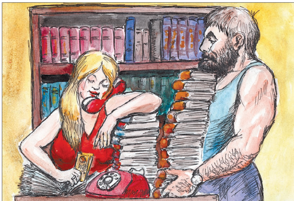
Рисунки Александра ДАНИЛКИНА

Пока стояли, выходил на бак, на корму, по левому, по правому борту — знакомился с судном.